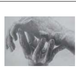
重い荷物を軽々と持つ